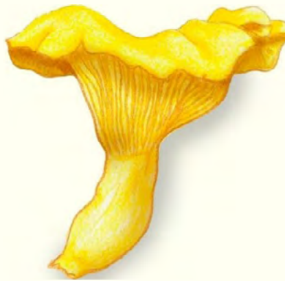
2) Cantharellus cibarius