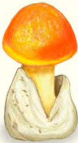
1) Amanita caesarea

Rápidamente el guía del grupo cargó al niño y lo llevó al centro de salud más cercano para que le pudieran prestar atención médica; todos estaban muy asustados porque Chuchito no dejaba de