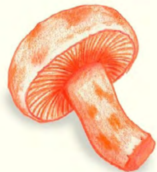
3) Lactarius salmonicolor